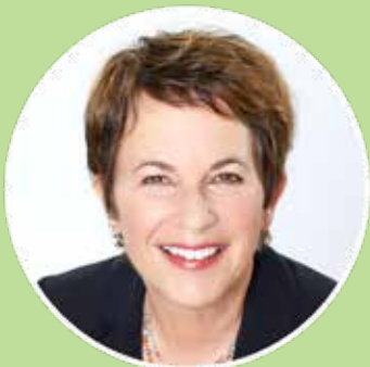
Fuente: Susan Bowerman, M.S., RD, CSSD, CSOWM, FAND – directora de nutrición de Herbalife.

7. Come los alimentos bajos en calorías primero: Cuando realmente tienes hambre y te estás sirviendo un plato de comida, es probable que te sirvas más de las comidas disponibles que tienen un mayor contenido de calorías, y también es probable que las busques primero una vez que te sientes a la mesa